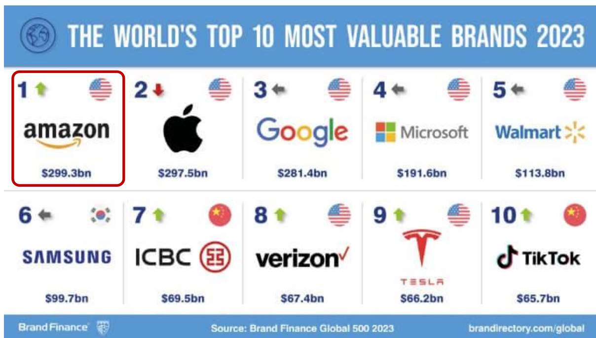
圖：Brand Finance 公佈 2023 年全球品牌價值 500 強排行榜